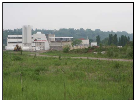
Übersicht des Gesamtgeländes