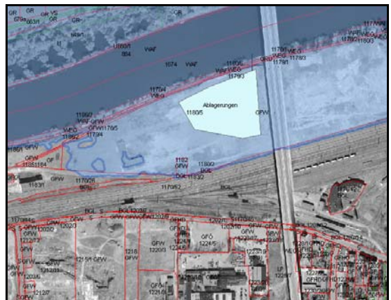
Lage der Altlast im Überschwemmungsgebiet