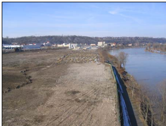
Lage der Altlast unmittelbar an der Elbe