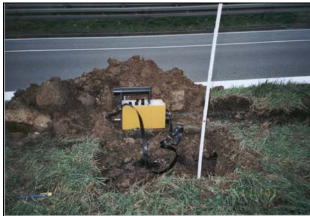
Schürfe zur Probennahme und ODL-Meßgerät