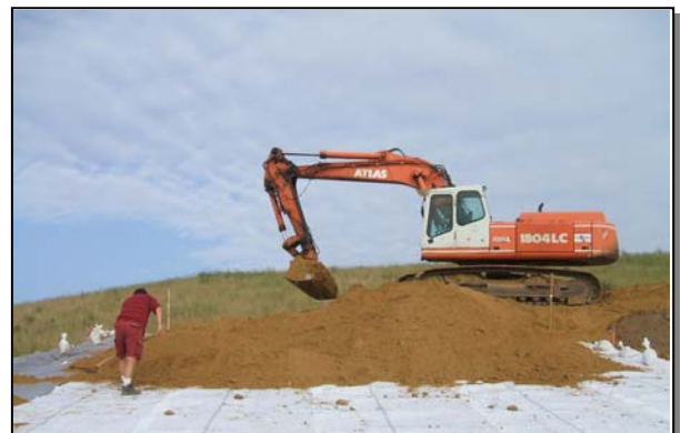
Einbau Rekuboden SA 1