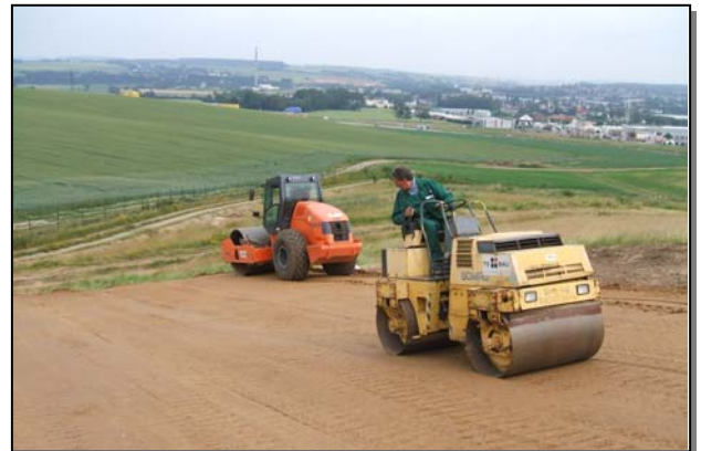
Dichtungsschichteinbau SA 1