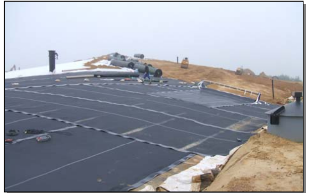
Ertüchtigung liegende mineral. Dichtungsschicht SA 2/3 (teilweise) KDB und Dränmatte SA 2/3 (teilweise)