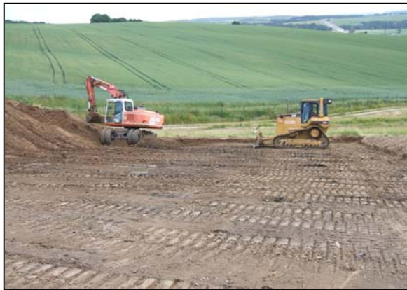
Profilierung SA 1