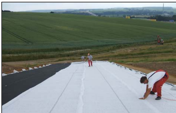
Velegen KDB und Dränmatte SA 1